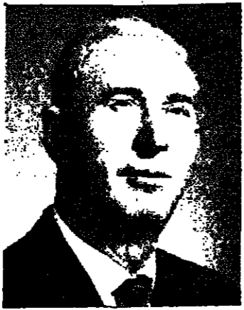
بقلم: شمعون لندمان

حي الفيلات الفخمة لعائلة الحسيني، والذي اقيم ونسق اسلوب اوروبي حيت، وعلى قرار ابناء التركي الرفه، والى الشمال الشرقي من القدس، احدث حركة عمراية شجعت وحضرت الازوساط الاستراقبية والماعلات المتناسفة بوجه خاص، على تقليده ومناسته.